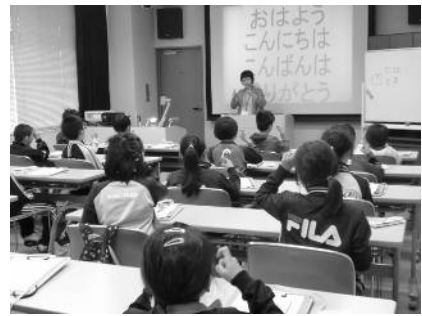
～手話表現をしてみよう～