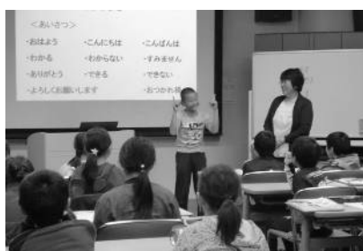
～「こんにちは」を手話で表現しよう～