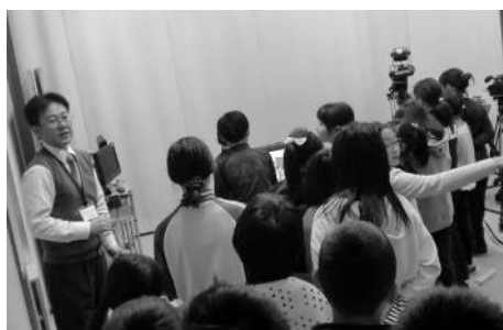
～スタジオ内見学の様子～